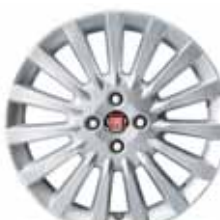
17-calowe obręcze kół WIPE OUT z lekkiego stopu w kolorze srebrnym z ogumieniem 205/45 R17 ▲ (opcja nr 435)