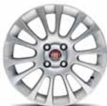
16-calowe obręcze kół HAAKON z lekkiego stopu w kolorze aluminium z ogumieniem 195/55 R16 ▲ (opcja nr 4AY)