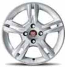
15-calowe obręcze kół OLLIE z lekkiego stopu w kolorze srebrnym, z ogumieniem 175/65 R15 ▲ (opcja nr 108)