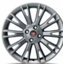
17-calowe obręcze kół DARK DOUBLE CORK z lekkiego stopu w kolorze ciemnoszarym (błyszczące) z ogumieniem 205/45 R17 ▲ (akcesoria)