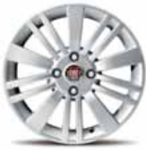
15-calowe obręcze kół WALLSLIDE z lekkiego stopu w kolorze aluminium z ogumieniem 185/65 R15 (opcja nr 208/432)