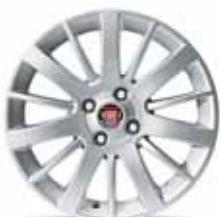
16-calowe obręcze kół HALFPIPE z lekkiego stopu w kolorze aluminium z ogumieniem 195/55 R16 ▲ (opcja nr 431)