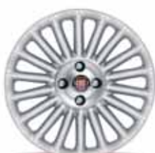
16-calowe obręcze kół GRAB z lekkiego stopu w kolorze aluminium z ogumieniem 195/55 R16 ▲ (opcja nr 439)