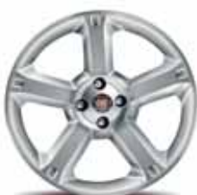
16-calowe obręcze kół SNAP z lekkiego stopu w kolorze aluminium z ogumieniem 195/55 R16 ▲ (akcesoria)