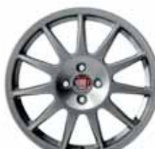
17-calowe obręcze kół AERIAL z lekkiego stopu w kolorze ciemnoszarym (matowe) z ogumieniem 205/45 R17 ▲ (akcesoria)