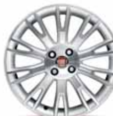
17-calowe obręcze kół DOUBLE CORK z lekkiego stopu w kolorze srebrnym/ ciemnym z ogumieniem 205/45 R17 ▲ (opcja nr 434)