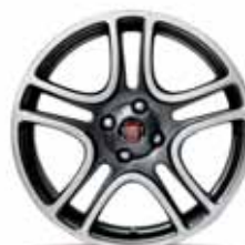
17-calowe obręcze kół TAKE OFF z lekkiego stopu w kolorze Chrome Shadow z ogumieniem 205/45 R17 ▲ (opcja nr 433)

Matowe, srebrne czy aluminiowe? 15- czy 17-calowe? Snap, Wallslide, Halfpipe? Fiat oferuje szeroką gamę felg do modelu Grande Punto, spośród których będziesz mógł wybrać te, które najbardziej odzwierciedlają Twoją osobowość.